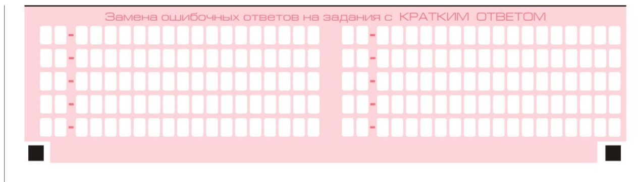
Рис. 8. Область замены ошибочных ответов на задания с кратким ответом

В нижней части бланка ответов № 1 предусмотрены поля для записи исправленных ответов на задания с кратким ответом взамен ошибочно записанных (рис. 8).