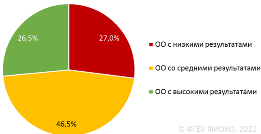
Рисунок 1. Распределение ОО по результатам (общероссийская выборка, 2021 г.)

При этом надо помнить, что образовательные результаты — это только один из показателей эффективности школы. Успешна ли школа в вопросах воспитания, профориентации? Зная ответы на эти вопросы, можно предположить, как работа школы сказывается на благополучии будущих выпускников.